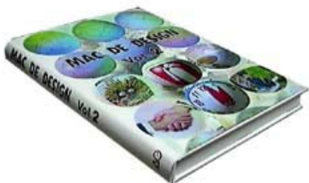
「MAC DE DESIGN 2」(¥16,000)

そこで、AG 出版に抗議文を11月4日付けで郵送しました。AG 出版からの回答は、驚くほど問題意識が低く、あきれかえるばかりのものでした。