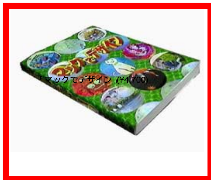
本件書籍と呼ばれるもの