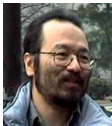
SF 画家 日本 SF 作家クラブ会員 日本出版美術家連盟理事、日本美術著作権連合理事