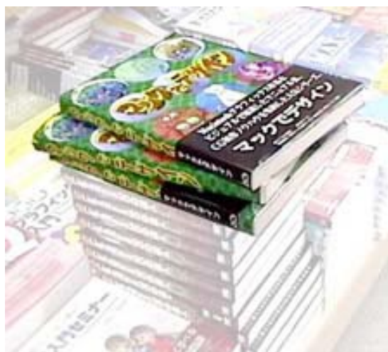
某書店でのスナップ